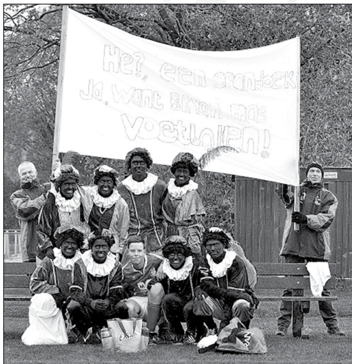
Uit de wedstrijd Nw Roden B1 tegen Zuidhorn B3 22 november 2014